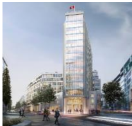
Springer Quartier Hamburg