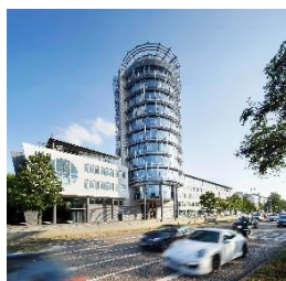
Albplatz Forum Stuttgart