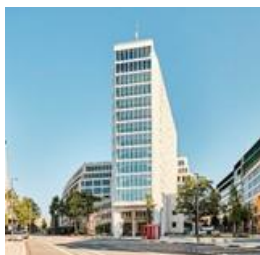
Springer Quartier Hamburg