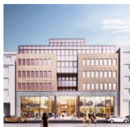
Galerie Luise Hannover